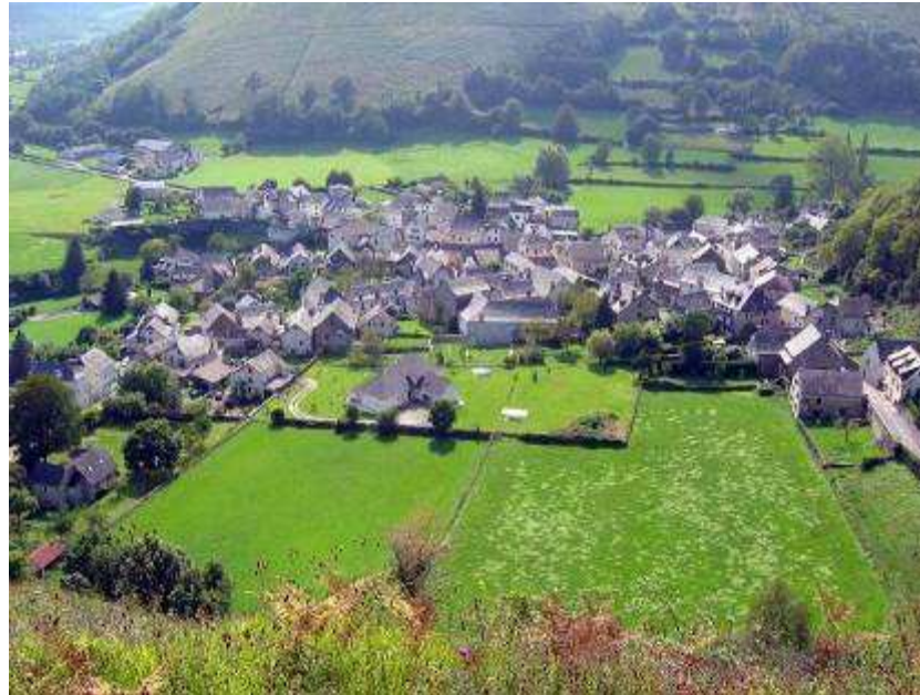
Vue du bourg d'Osse-en-Aspe depuis le Chemin du Mont